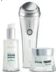
Kit ristrutturante 71007

Il device anti-age LR Zeitgard sfrutta la tecnologia caldo/freddo per trasportare più efficacemente i principi attivi anti-age negli strati più profondi della pelle.