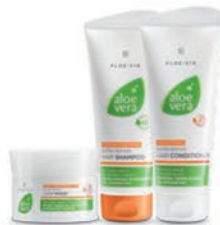
Aloe Vera Hair Care System Set 20763

La linea per capelli LR Aloe Via contiene una combinazione unica di Aloe Vera Gel e 7 oli naturali che nutrono, rafforzano e riparano i capelli proteggendoli da rotture.