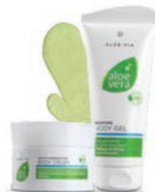
Aloe Vera Slimming Set 27529

LR ALOE VIA si prende cura della pelle con Aloe Vera per una silhouette più definita e tonifica pancia, parte superiore delle braccia, cosce e glutei.