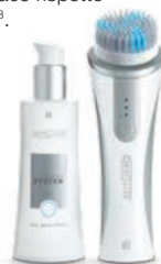
Cleansing System Kit Classic 70036

Grazie alla sua speciale tecnologia, LR ZEITGARD 1 effettua una pulizia della pelle delicata ma profonda, fino a 10 volte più efficace rispetto ad una normale pulizia 3 .